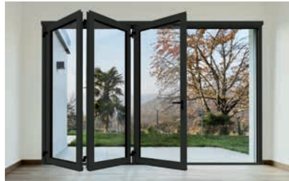
Porte GTI repliable Jusqu'à 6 vantaux ▼

Test d'endurance Porte P70 GTI+ certifiée classe 8