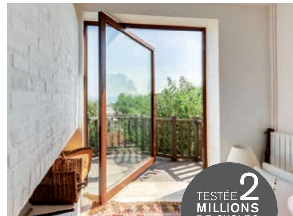
Porte pivot décalé ▲ Largeur jusqu'à 2100 mm