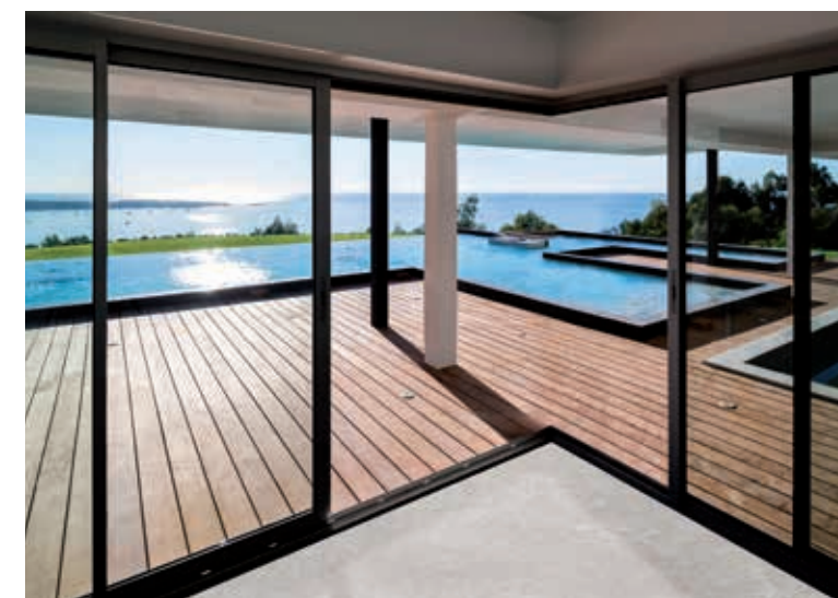
Baie coulissante avec ouverture centrale (système ouvrant sur fixe) ▲ ◀ Baie coulissante à galandage

Jusqu'à 8 vantaux, angle sans poteau, galandage, fixe-ouvrant..